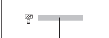
Tira con esporas Spore strip